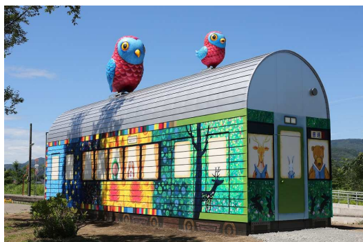
ジミー・リャオ「Kiss & Goodbye」